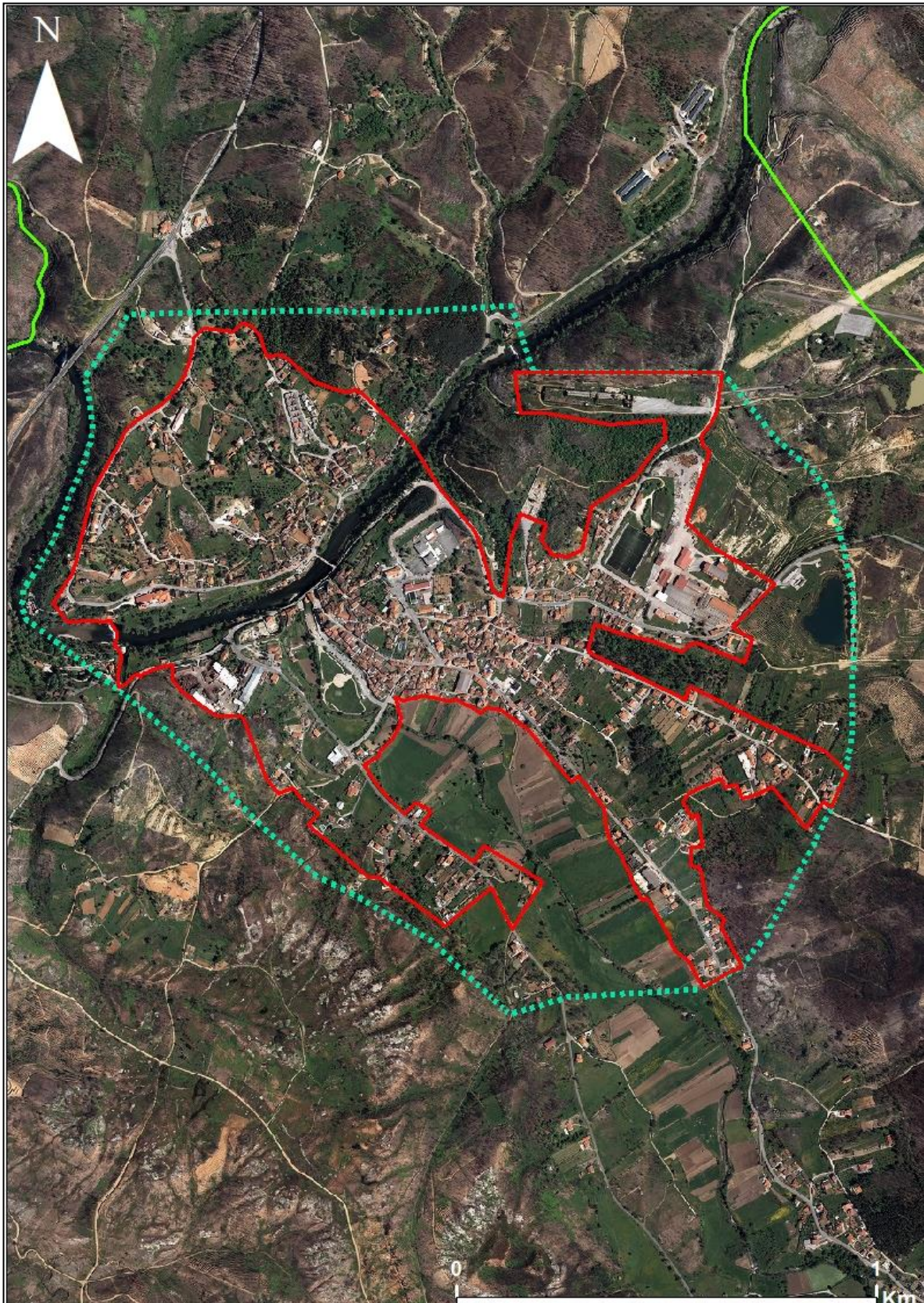
Alteração da ARU de Coja MEMÓRIA DESCRITIVA E JUSTIFICATIVA